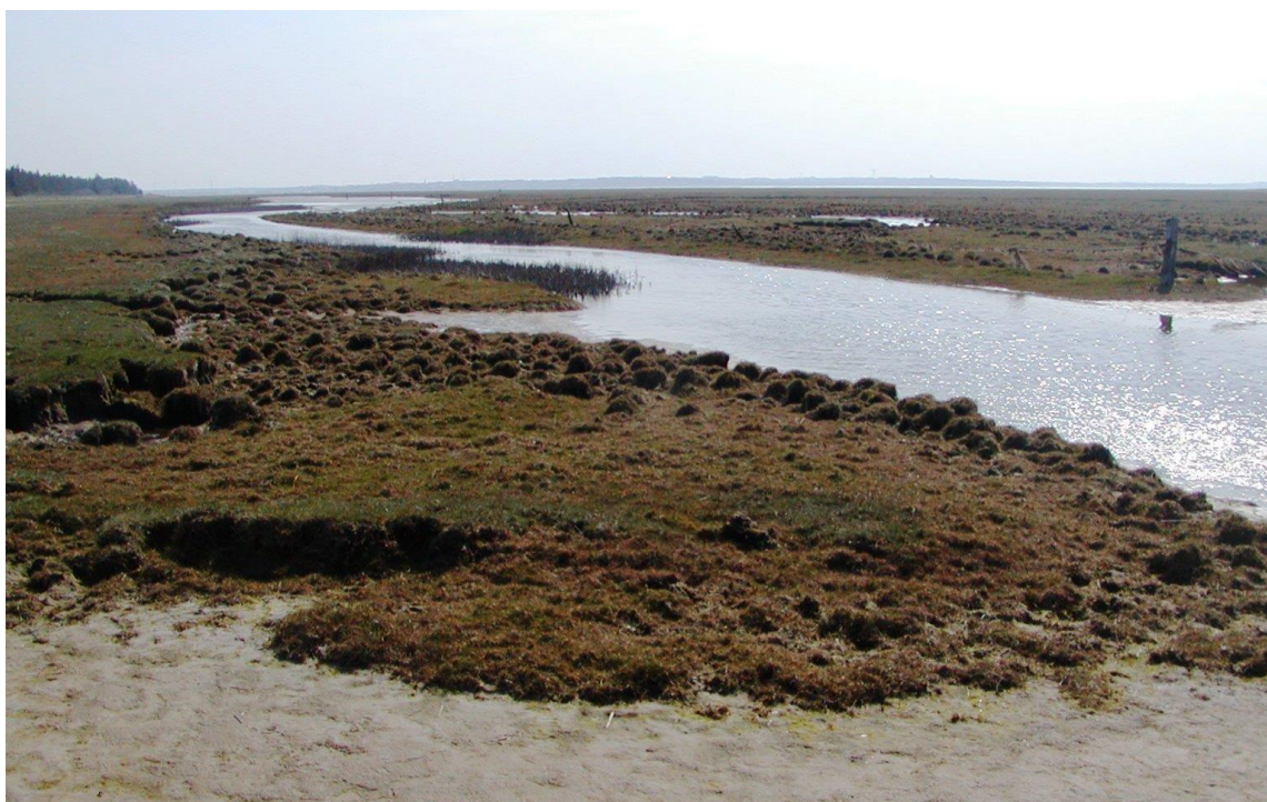
Figur 6: Strandeng ved Aggersund Nord.