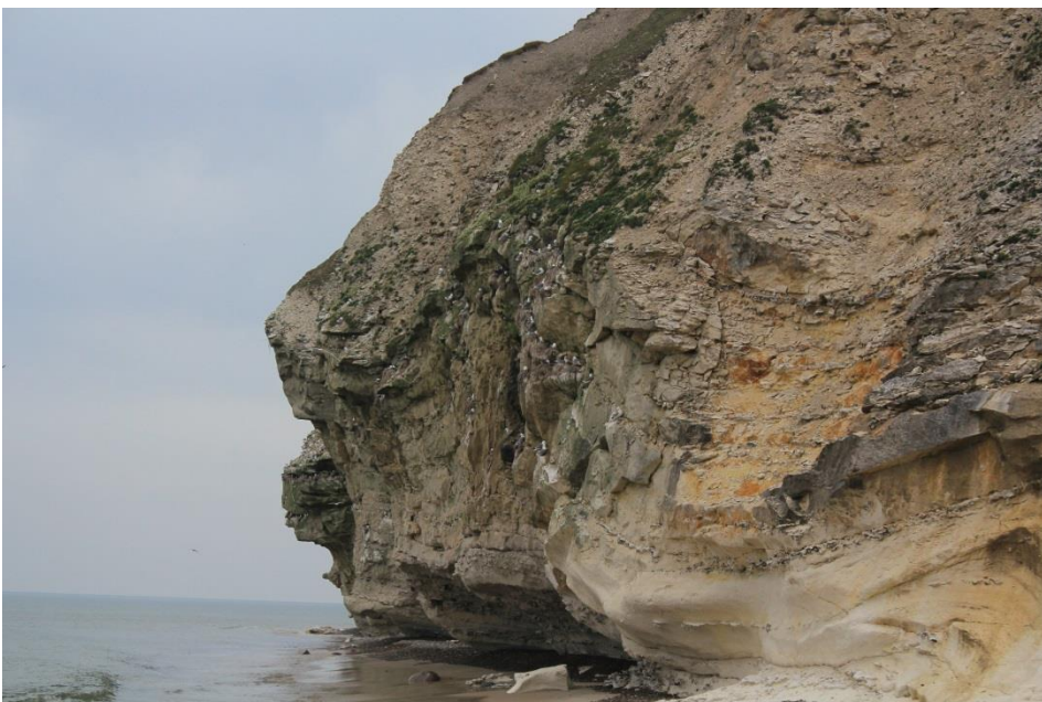
Figur 4: Bulbjerg Klint.

Naturstyrelsen har gennemført 37 indsatser i dette Natura 2000 område i perioden 2010-2015. Disse indsatser består af en række plejetiltag, herunder konvertering af skov til lysåbent natur, rydning af læhegn og vedligeholdende pleje med fjernelse af nåleopvækst, på et areal der udgør i alt 134 ha. Disse indsatser har bidraget positivt til opfyldelse af Natura 2000-planens målsætninger og har været til gavn for arter og naturtyper på udpegningsgrundlaget. En mere konkret redegørelse af Naturstyrelsens indsats kan ses på Naturstyrelsens hjemmeside .