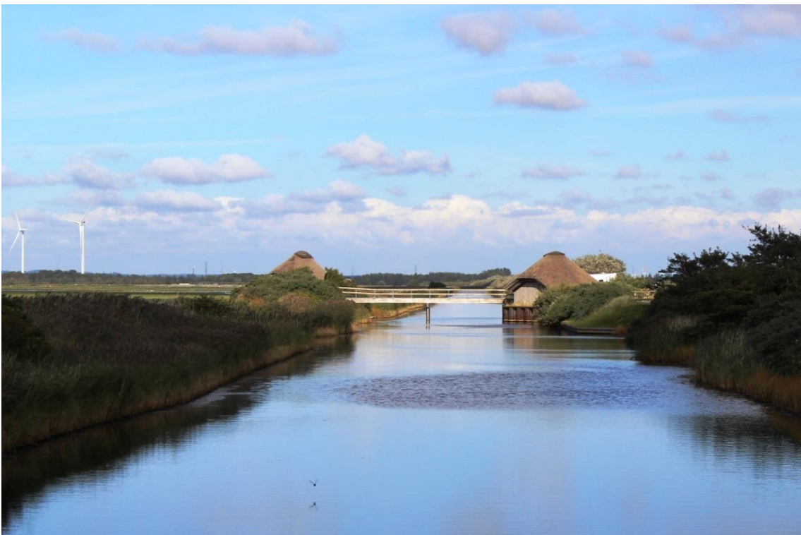
Figur 7: Glombak Kanal med udsigt til Åge V. Jensens naturcenter.

Kommunerne forventer at arbejde for et fortsat godt samarbejde med Aage V. Jensens Naturfond i forhold til videns udveksling omkring plejetiltag til gavn for de beskyttelseskrævende fugle på udpegningsgrundlaget.