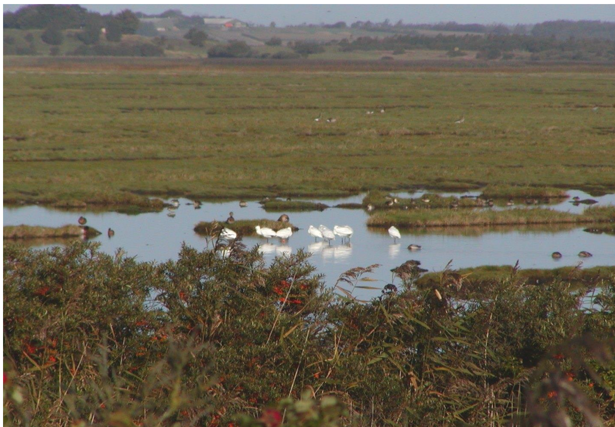
Figur 5: Skestork på Bygholm Vejle. Skestork er på udpegningsgrundlaget for Fuglebeskyttelsesområderne F13.

Området er med sine fem fuglebeskyttelsesområder en vigtig lokalitet for en lang række af yngle- og trækfugle (se bilag 2). En stor del af de nødvendige tiltag for disse arter vedrører vandstand og vandområder, hvilket skal varetages med vandplanerne, samt store uforstyrrede områder hvilket sikres gennem vildtreservaterne og den generelle drift af Vejlerne. Derudover er en stor del af disse fuglearter afhængige af afgræssede strandenge, hvorfor indsatsen for naturtyperne i væsentlig omfang forventes at bidrage til at sikre egnede levesteder for arterne.