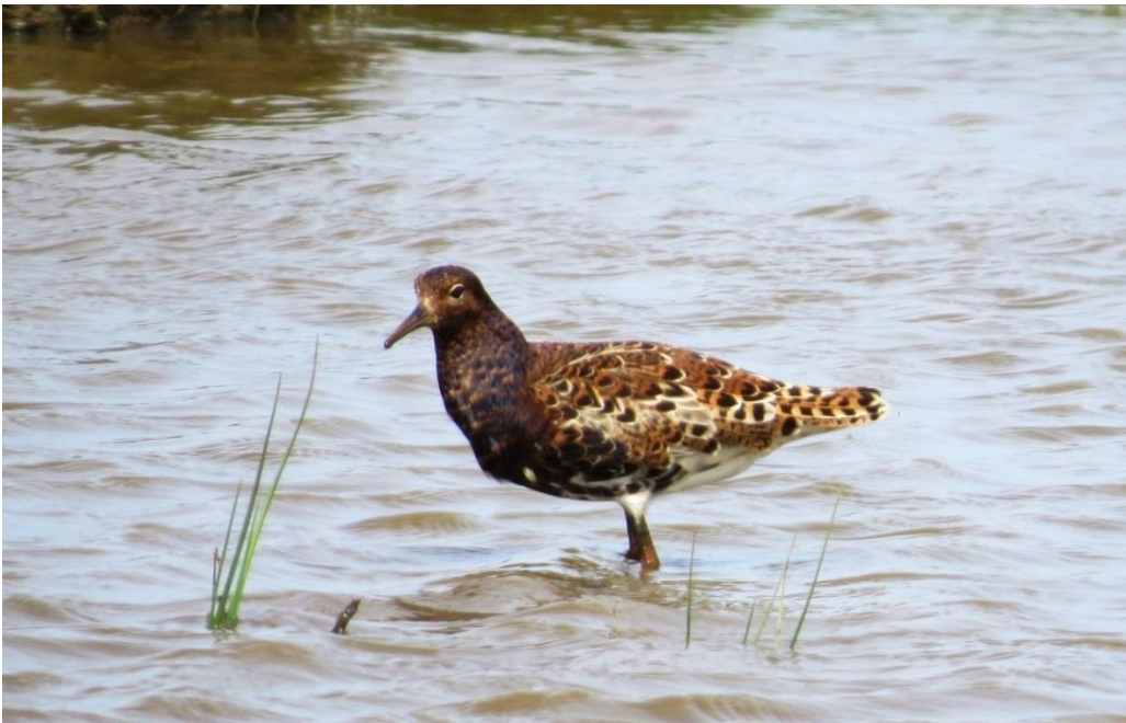
Figur 3: Brushane er en af arterne på udpegningsgrundlaget for fuglebeskyttelsesområderne F13 og F20.