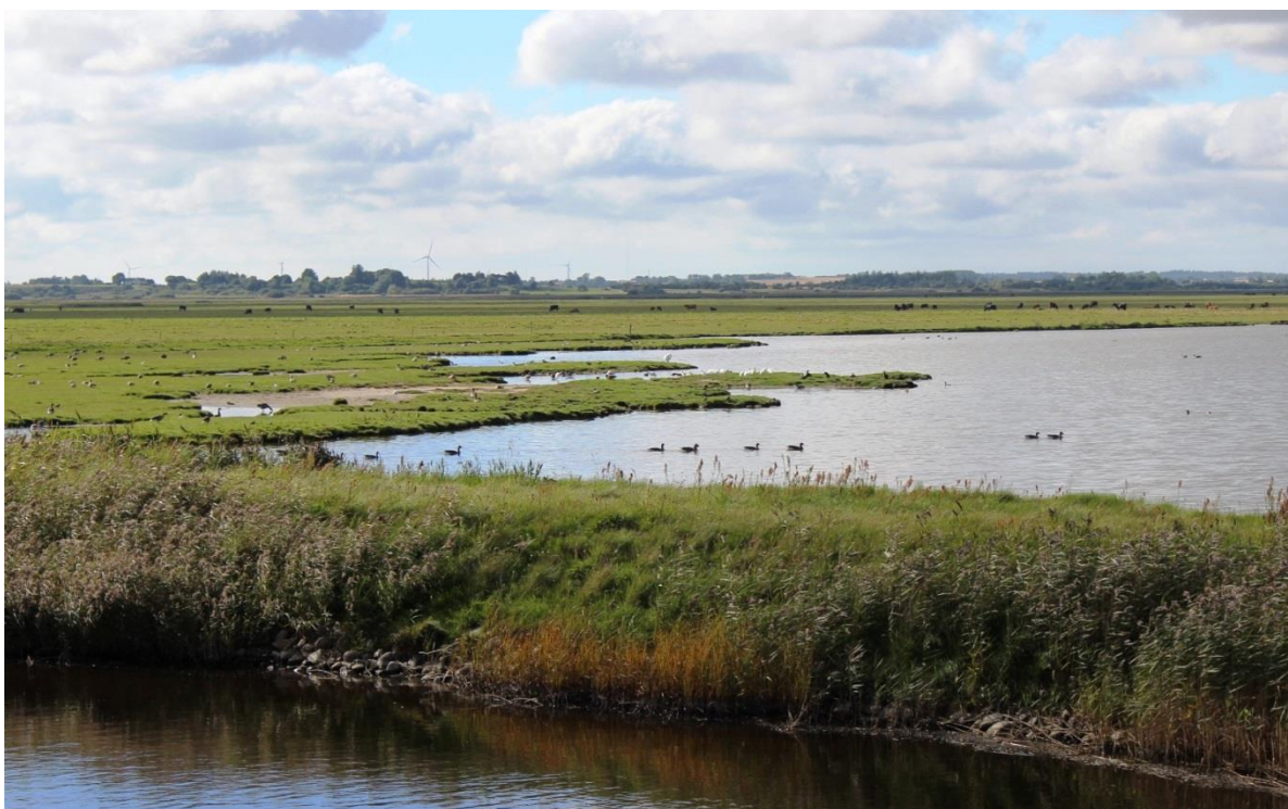
Figur 2: Udsigt over Bygholm Vejle. I baggrunden ses græssende kreaturer.

Den kommunale Natura 2000-handleplan er som udgangspunkt omfattet af krav om miljøvurdering i henhold til lov om miljøvurdering af planer og programmer (lovbekendtgørelse nr. 1533 af 10. december 2015). For samtlige statslige Natura 2000-planer er der foretaget en strategisk miljøvurdering. Handleplanerne har et indhold, der ikke adskiller sig fra de oplysninger, som allerede er givet i de miljøvurderede Natura 2000-planer. Da handleplanen ikke sætter nye rammer for fremtidige anlægstilladelser eller yderligere vil kunne påvirke internationalt udpegede naturbeskyttelsesområder væsentligt, har kommunerne truffet afgørelse om, at der ikke er behov for en fornyet miljøvurdering.